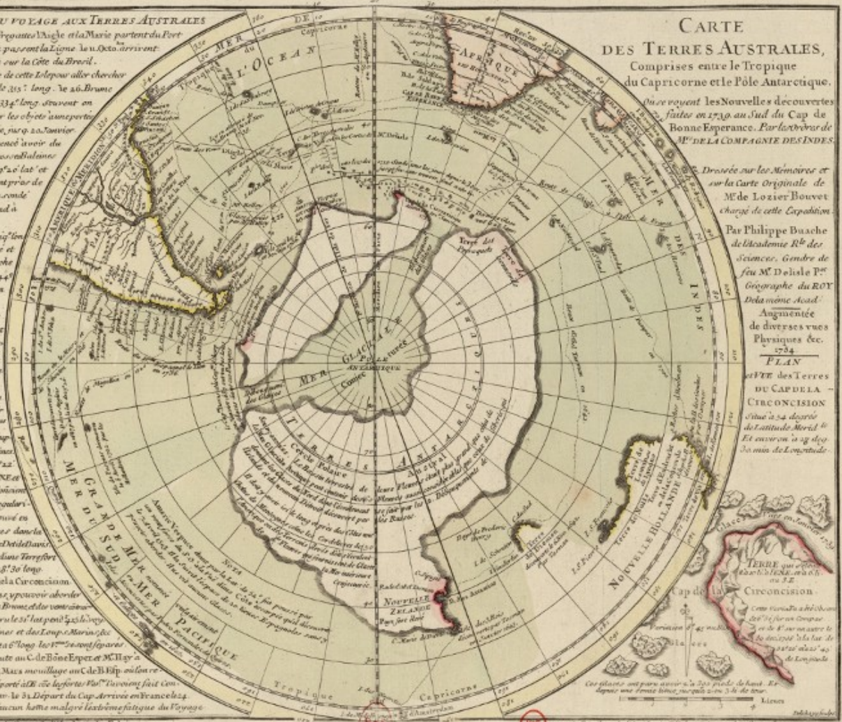
A 1739 map of the Antarctic

PLAN de la Carte de la Terre de la CIRCONCISION Située à 24 degrés de Latitude Merid. Et environ à 12 deg 30 min de Longitude.